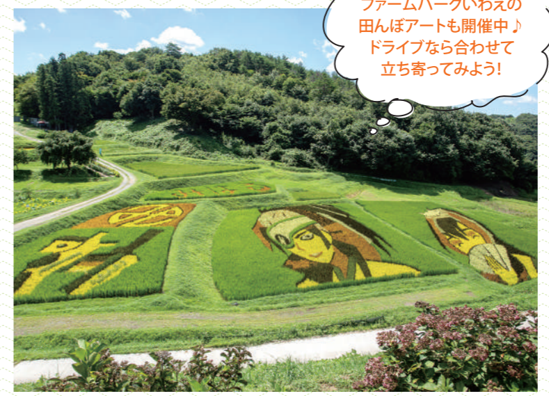
[場所] 三春町大字上舞木字板子内

ファームパークいわえの田んぼアートも開催中! ドライブなら合わせて立ち寄ってみよう!