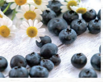
果実が大きく、酸味と甘みのバランスが良い「ハイブッシュ系」という品種が主に栽培されています。