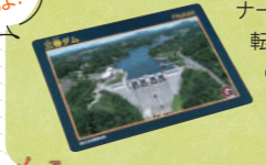
🚲 [場所] 三春町大字西方字中ノ内403-4