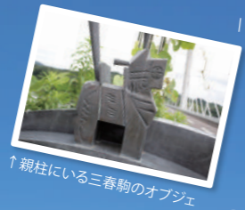
↑ 親柱にある三春駒のオブジェ