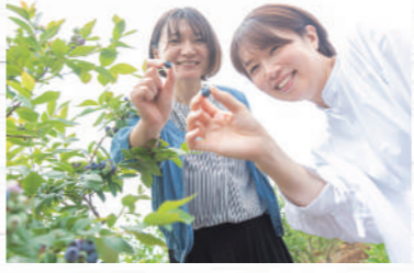
低木なので、女性や子どもたちも摘み取りやすい!

ブルーベリーの里とも呼ばれる三春町は、かつて桑や葉タバコの栽培が盛んでした。その畑を利用して、新しい特産品となったのがブルーベリー。日当たりの良い丘陵地を利用した農園は現在6カ所あり、栽培と摘み取り体験を行っています。令和4年は6月25日に一斉にオーブンし、8月中旬頃までの期間、様々なブルーベリーを楽しめます。農園によって栽培している品種が異なるので、食べ比べもオススメです!詳しい場所は左ページで☆