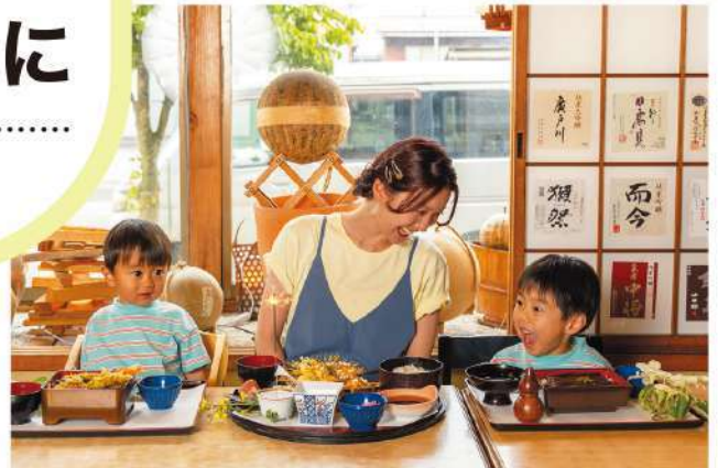
「わー、花火だあ!」。ちなみちゃんファミリーも大興奮の花火に乗った「大地雷火定食」(2,200円)

乙女心くすぐる季節限定スイーツを堪能♪ 華やかなケーキや焼菓子や並ぶ可愛いお菓子屋さん。近隣のおいしいフルーツにこだわり、無添加で安心して食べられるおいしさを大事にしています。奥にはアンティークな雰囲気のインテリア雑貨が彩る素敵なカフェがあり、シヨークースから選んだケーキや季節限定のかき氷、カフェを楽しめますよ。