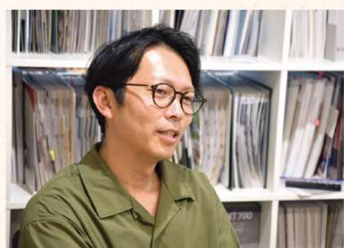
↑ 独立して1年余り。県内はもちろん東京の店舗も手がける。

ることが好きな人には、ぜひ空間デザインの仕事に興味を持ってほしいです。でも、私自身がそうだったように、やりたいことが最初からはっきり決まっていなければならないと思っています。具体的な