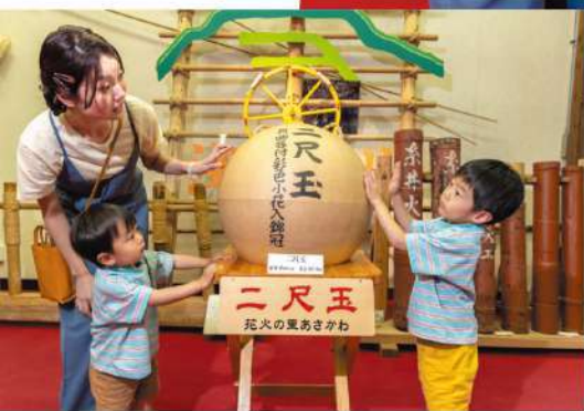
花火の歴史を展示する「浅川町歴史民俗資料館」を見学。展示されていた実物大の二尺玉の迫力に子どもたちもびっくり!